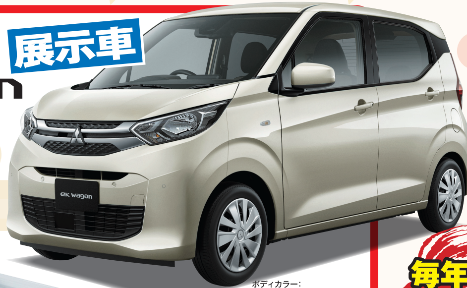
ボディカラー: ナチュラルアイボリーメタリック