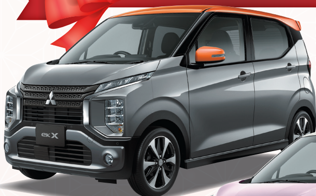
PHOTO:T Premium(4WD) ●ボディカラー：チタニウムグレーメタリック/サンシャインオレンジメタリック (有料色60,500円高) 有料色代は車両本体価格に含まれておりません。

クロス ek ekクロス T Premium(4WD) ハイブリッド 0.659L インタークーラー付ターボチャージャー DOHC 12バルブ・CVT・2WD[4人乗り] 車両本体価格 2,060,300円