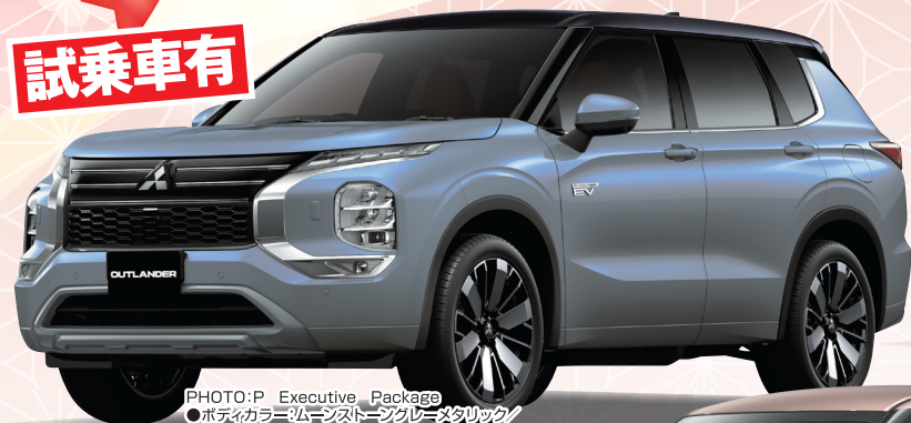
PHOTO:P Executive Package ●ボディカラー：ハルマシオンブルーメタリック/ブラックマイカ (有料色3110,000円) 有料色代は車両本体価格に含まれておりません。