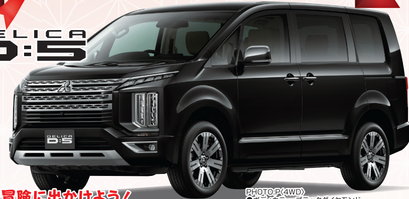
PHOTO:P(4WD) ●ボディカラー：ブラックダイヤモンド (有料色77,000円高) 有料色代は車両本体価格に含まれておりません。

さあ、冒険に出かけよう! デリカD:5 P(4WD) 2.2L コモンレール式DI-D インタークーラー付ターボチャージャー DOHC 16バルブ・8速スポーツモードA/T・電子制御4WD[8人乗り・7人乗り] 車両本体価格 4,601,300円