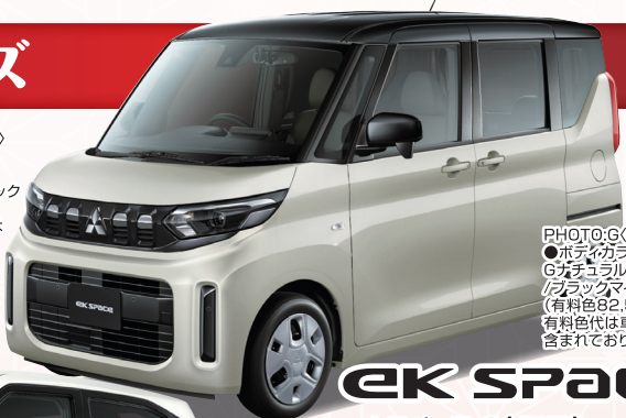
PHOTO:G(4WD) ●ボディカラー：Gカラー/アイボリーメタリック/ブラックマイカ (有料色82,500円高) 有料色代は車両本体価格に含まれておりません。

クロス ek ekクロス T Premium(4WD) ハイブリッド 0.659L インタークーラー付ターボチャージャー DOHC 12バルブ・CVT・2WD[4人乗り] 車両本体価格 2,060,300円